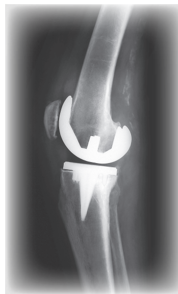
※写真/人工関節の手術を受けたひざ